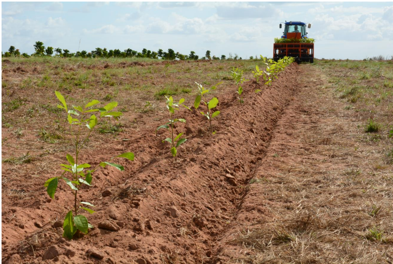
Mudas plantadas pela maquina (rapidez e qualidade)