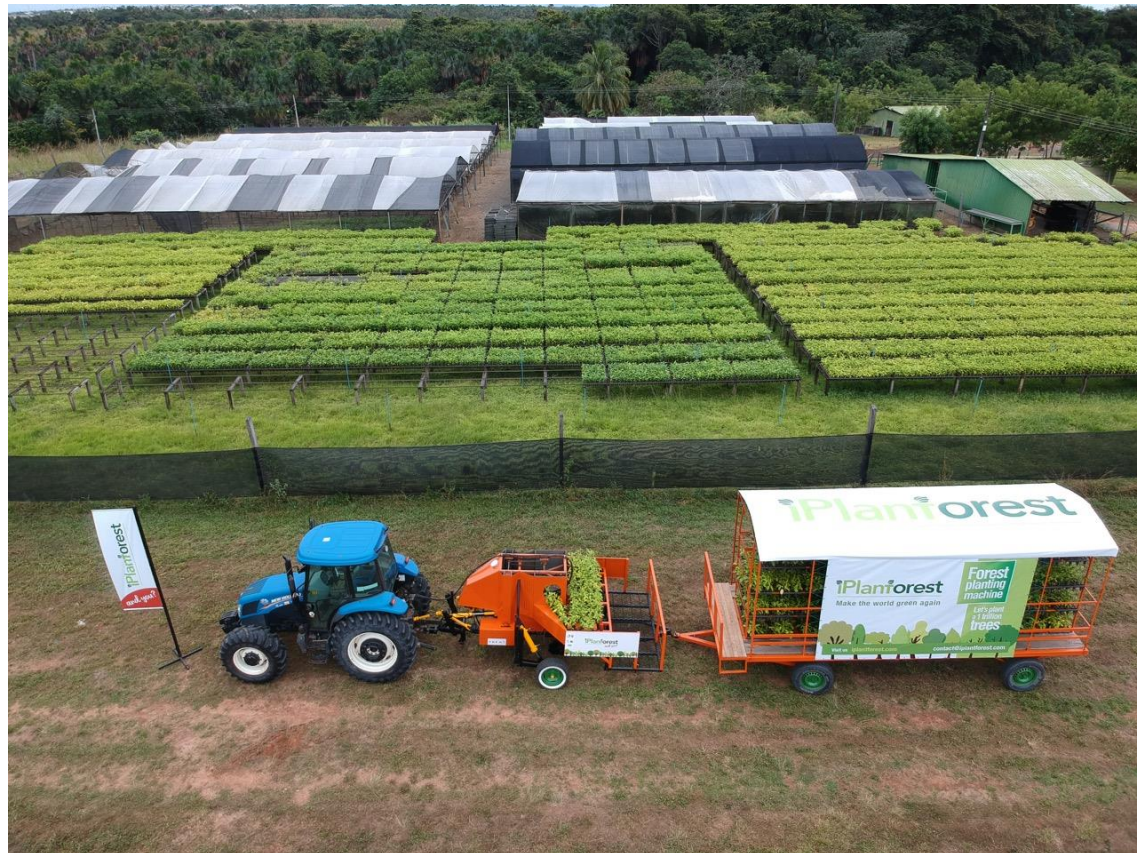
Visão parcial do viveiro em Roraima Viveiro para 6 milhões de mudas